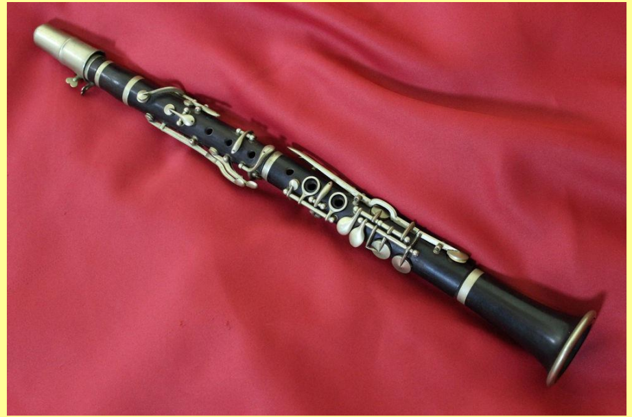
La petite clarinette à sa naissance (en 1815)

Entre 1800 et 1900, au XIXe Siècle, la clarinette change et s'améliore. Elle a de nouvelles clés et peut jouer toutes les notes.