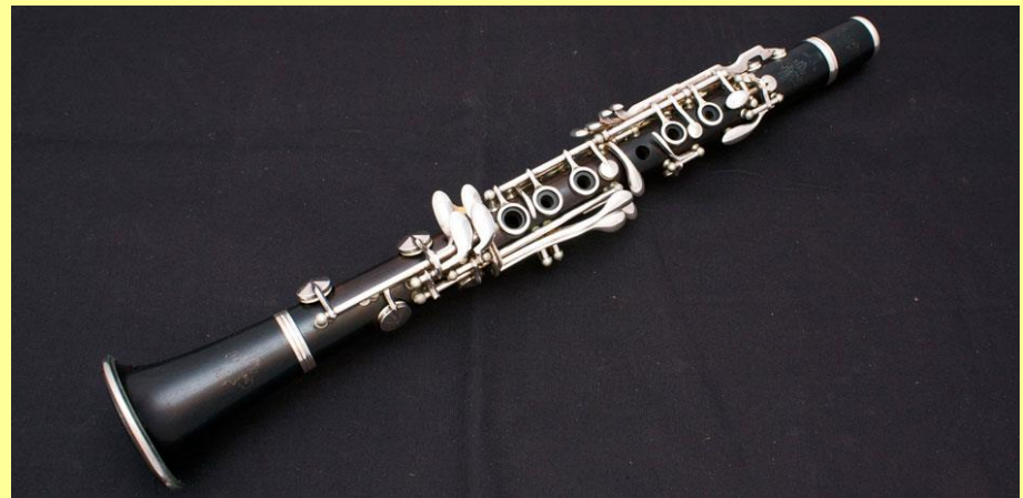
La petite clarinette 30 ans après

Voici à quoi ressemblait la clarinette contrebasse à sa naissance.