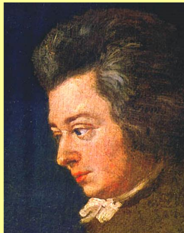
(W.A. MOZART, 1756-1791)

La clarinette n'avait que 70 ans quand Mozart l'a découverte !